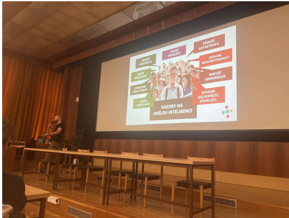
Kyberakademie – vzdělávací kurz pro strážníky v oblasti kyberkriminality