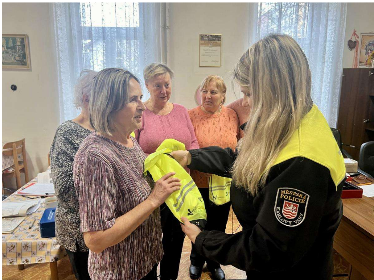
Předávání bezpečnostních balíčků parasportovcům a seniorům