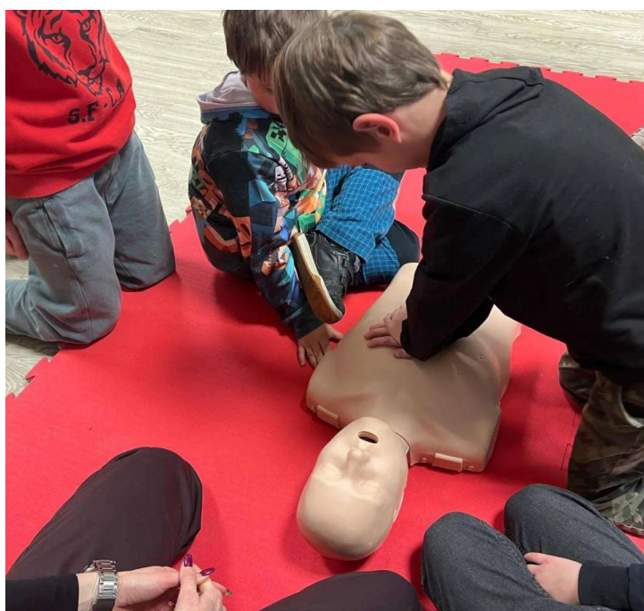
„Mladý strážník“ – kurz 1.pomoci