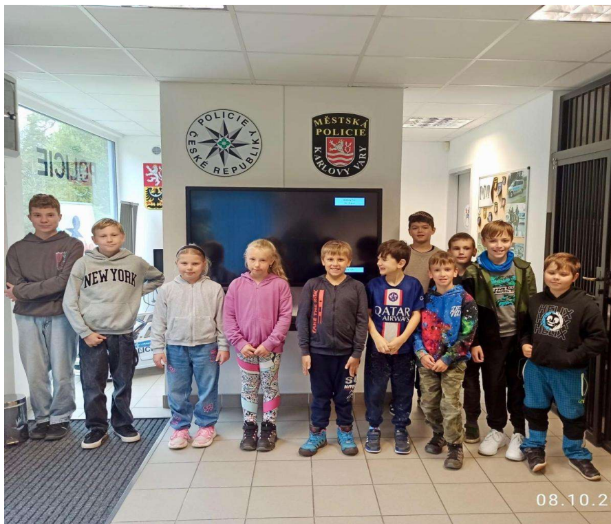
Zahajovací schůzka kroužku „Mladý strážník“

V Centru zdraví a bezpečí opět probíhal kroužek „Mladý strážník“. Na jaře 2025 končil třetí ročník a v říjnu 2025 začínal čtvrtý, který navštěvuje 16 dětí. Spolupráce s Domem dětí a mládeže Karlovy Vary, který zajišťuje administrativní část projektu, se osvědčila, proto touto formou bude kroužek pokračovat.