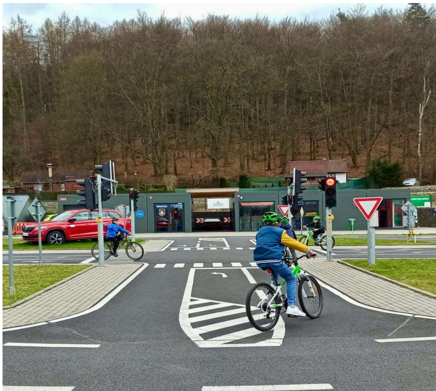
Dopravní výchova v CZB

Během celého školního roku 2024/2025 probíhala dopravní výchova pro 4. ročníky základních škol z celého Karlovarského kraje pod vedením strážníků, kteří působí v centru jako lektoři Asociace záchranný kruh, jedná se převážně o strážníky z výkonu služby.