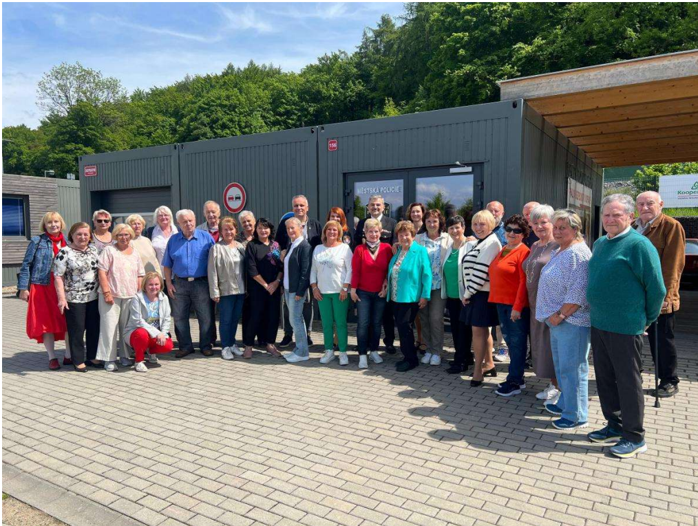
Ukončení 15. ročníku Senior akademie