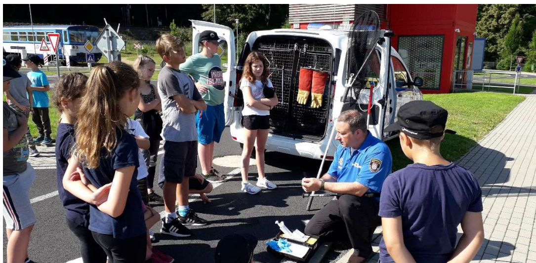
Příměstský tábor v CZB – program MP KV

V podzimních měsících pracovalo centrum již bez omezení. V září zde městské policie z Karlovarského kraje, pod vedením Městské policie Karlovy Vary, uspořádaly akci pro veřejnost s názvem „Den s městskou policií“, Akce byla zároveň pojata jako připomenutí 20 let existence oddělení prevence v Karlových Varech.