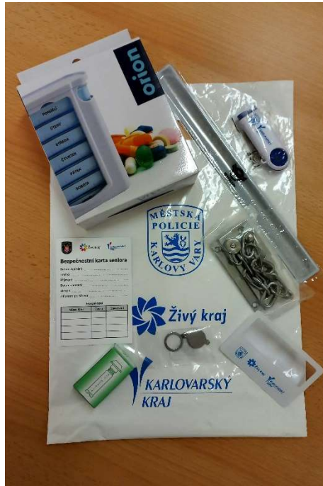
Bezpečnostní balíček pro seniory

Díky dotační podpoře Karlovarského kraje vznikly „Bezpečnostní balíčky pro seniory, které preventivně koncem roku 2021 distribuovali nejen mezi posluchače Senior akademie, ale také mezi členy zájmových organizací seniorů ve městě a prostřednictvím MZSS i mezi osaměle žijící seniory.