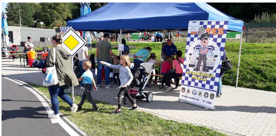
Den s městskou policií