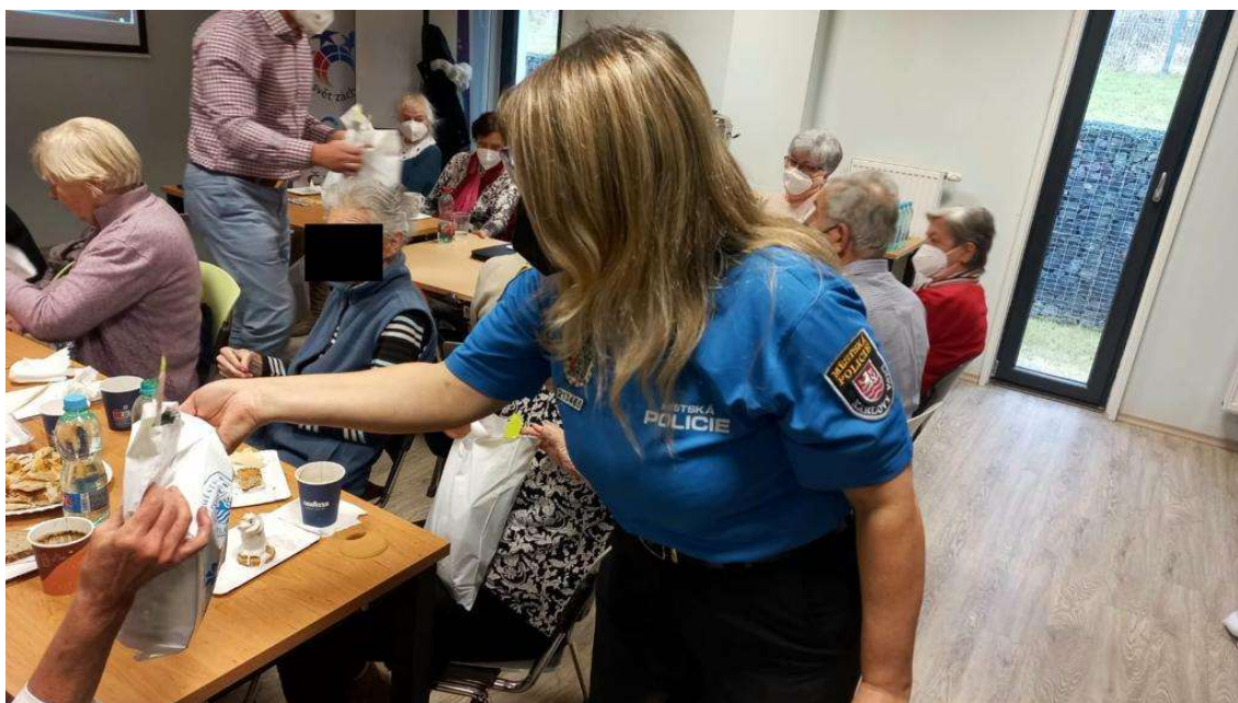
Předávání bezpečnostních balíčků