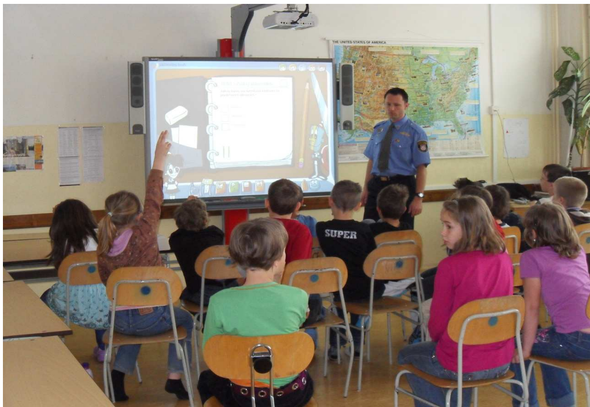
Práce s dětmi na I. stupni ZŠ