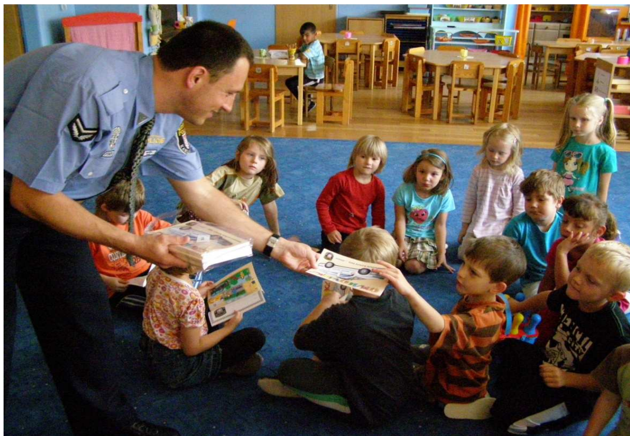
Práce s dětmi v mateřských školách