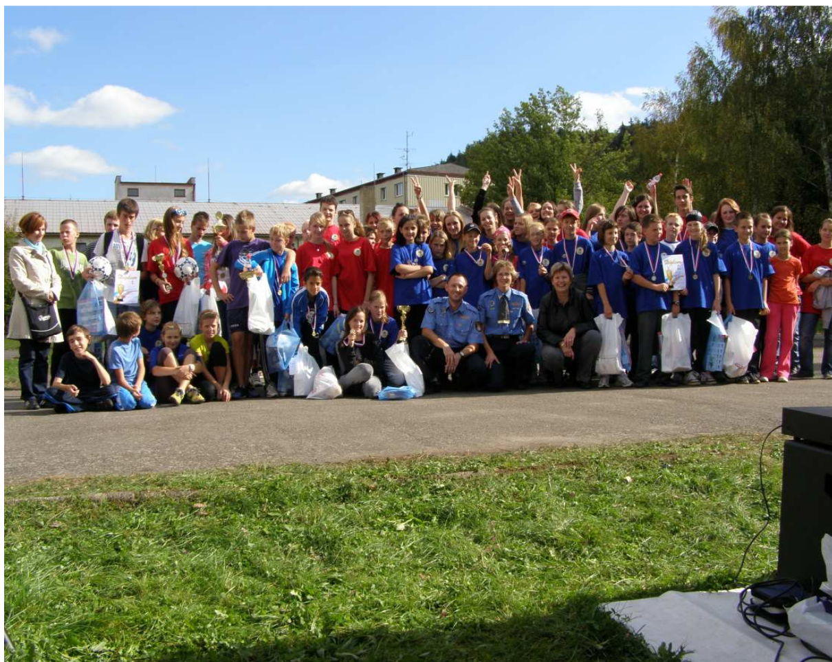
Sportovně vědomostní soutěž Putovní pohár Městské policie Karlovy Vary